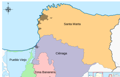
Ilustración 1 Mapa de la zona bananera del Magdalena