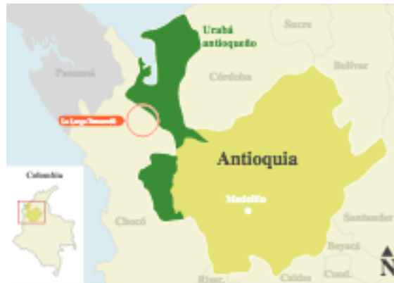
Ilustración 2 Mapa de Antioquia resaltando el Urabá

El Magdalena medio y el Urabá Antioqueño son elegidos como los lugares por excelencia para el cultivo propicio del banano, una de las principales razones es que la selección de suelos para el cultivo debe tener condiciones esenciales que no sean ácidos, ya que esta condición limitaría el desarrollo y llevaría a enfermedades que obtiene el cultivo. (Mena, 2009)