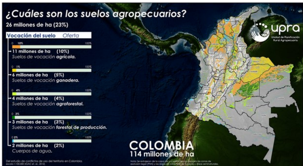
Ilustración 5: ¿Cuáles son los suelos agropecuarios?

Por tal motivo el gobierno ha decidido crear 2 programas que juegan un papel importante en el sector. El primero de ellos se llama Colombia Siembra, que básicamente consiste en habilitar alrededor de un (1) millón de hectáreas, con el fin de lograr seguridad alimentaria para el país, también para mejorar los precios a los consumidores y volver a todos los partícipes de este sector lo más eficiente posible con productos de muy alta calidad (Ministerio de Agricultura, 2015). Así mismo este programa va a aclarar para el sector y todos aquellos que quieren empezar a ser parte de este y también para los que ya pertenecen, lo que realmente debe realizarse en las tierras y utilizarlas para la vocación adecuada de cada una de ellas (Ministerio de Agricultura, 2015). Por tal motivo, la UPRA (Unidad de Planificación Rural Agropecuario) definió este mapa donde se muestra el total de las tierras en Colombia y para qué tipo de actividad se debería utilizar y da un diagnóstico en conjunto con el Dane, donde dan cifras de la tierra que quedará disponible en el país con sus respectivos y adecuados usos.