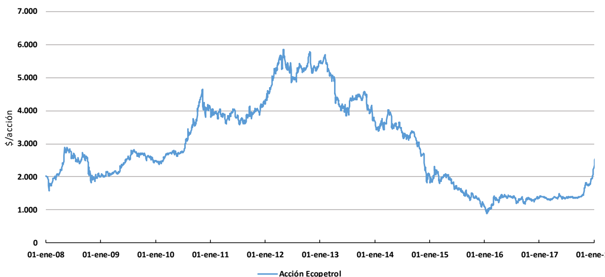
Gráfica 2. Comportamiento de la acción de Ecopetrol.

valorización en los últimos cinco años en más del 85%. Un rally bajista que de entrada tiene una explicación con la abrupta caída del precio del crudo internacional.